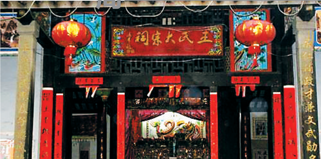
位于海南琼中的王氏大宗祠。(资料图片)

始祖通常是指得姓的祖先，亦指有世系可考的最初的远祖，对于讲究慎终追远的中国人来说，祖先崇拜近似一种宗教习惯。而海南由于地理位置特殊，孤悬海外，海南文化中的“始祖”通常是指本族本姓第一个登岛的先人，即“入琼始祖”或“渡琼始祖”，这成为海南独特的祖先崇拜文化。