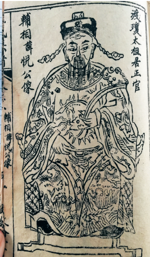
王氏族谱里的王居正画像

枝繁叶茂，据记载，他后来定居原琼山东南交潭社村，生育九个男孩：尚仁、尚义、尚礼、尚智、尚信、尚忠、尚质、尚文、尚和。除尚和没有后裔外，其他八兄弟都在海南繁衍后代，其后代遍布海南及东南亚各地。历代海南王氏出了不少名人、贤臣，从宋代起中进士就有九人，中举人亦有二十五人，这些人有相当部分都是王居正的后裔。