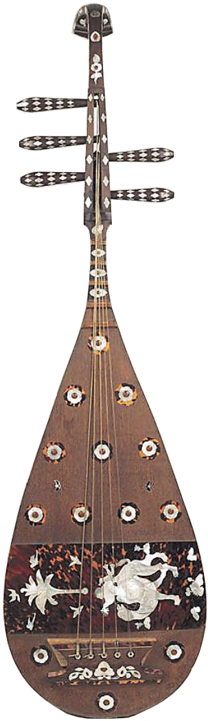
日本正仓院所藏的螺钿紫檀五弦琵琶。

自唐宋以来,海南就是中西商船往来的避风港、补给港和转运地。明朝郑和下西洋,七经海南岛;海南历代渔民手中的《更路簿》,是记录古代海上丝路的重要航经;南海大量古代中外沉船和出水文物,也是古丝路的历史见证者,其中,在海南西沙群岛附近岛礁出水的印度小叶紫檀木近年来得到了收藏界的追捧。