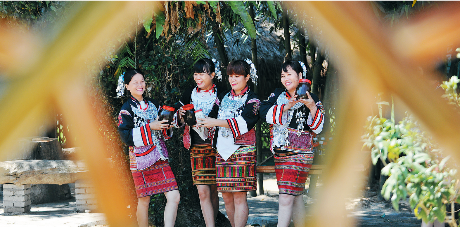
琼中什寒村的村民为游客跳起民族舞蹈,捧出自酿的山兰酒饱饕游客。

据中新网消息,近日,途牛旅游网发布的《2015上半年中国在线出境旅游报告》中显示,上半年90后出境游人次增加了3.5倍。而更为有意思的是,二线城市的市民出国旅游的兴致旺盛,太原、昆明、厦门等城市居民出境游同比均上涨10倍以上。日本拔得短线境外游的头筹,成为上半年中国居民最爱去的境外旅游目的地。 2015年,我国在线出境游市场又有哪些新变化和新趋势?2015年上半年出境游市场仍在快速增长,从出发地看,一线城市上海、北京的出境旅游人次全国最高,这与当地消费者出境游消费习惯较为成熟不无关系。 而上半年去哪里旅游最火爆?根据途牛的数据显示,日本成为短线境外游最热的目的地。首先,日元对人民币汇率最近两年持续贬值;其次,日本将免税商品从家电、服装及包类,扩大到酒类、食品、化妆品及医药品,使得赴日人群购物热情高涨。 而从境外游预订用户年龄来看,20—40岁人群占到了50%以上,成为出境旅游的主力军。此外,90后逐渐步入职场,拥有了一定的资金储备,对于出游尤其是出境游兴趣更高,今年上半年,90后出境游人次同比增长近350%,未来这一群体在出境游中将占到更高比重。