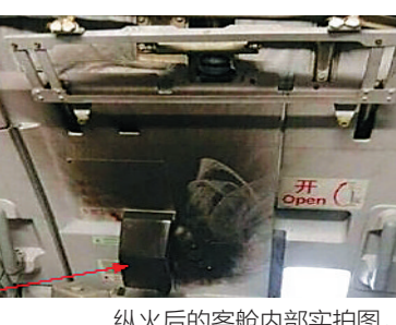
纵火后的客舱内部实拍图。

专家指出,安检工作既要有科学有效的体制机制保障,更需要安检人员高度的责任心、严谨细致的工作作风,才能让旅客不带一丝安全疏漏上飞机。