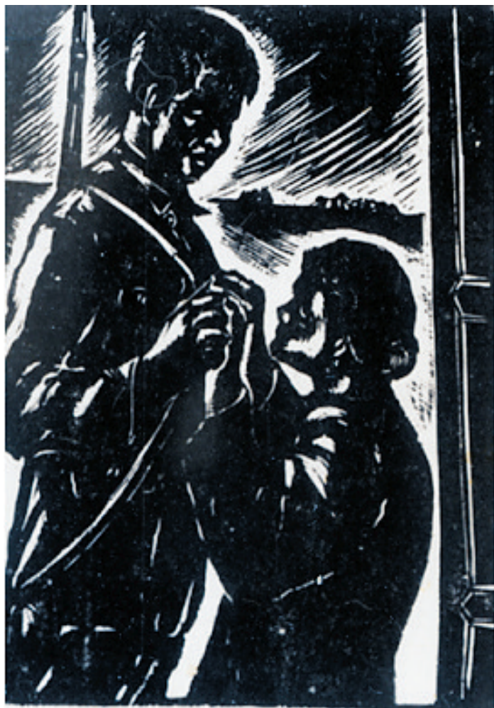
《儿啊,为了祖国,勇敢些!》(木刻) 卢鸿基 1938年作