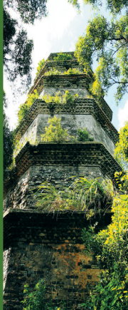
位于文昌铺前镇七星岭上的斗柄塔,既是一座风水塔,同时又兼有灯塔的功能。

下窰得天时地利。有舟楫之便,有肥美良田,有辽阔河滩,傍近府城,市井繁华;所以,小村富甲一方,既是鱼米之乡,又是砖瓦