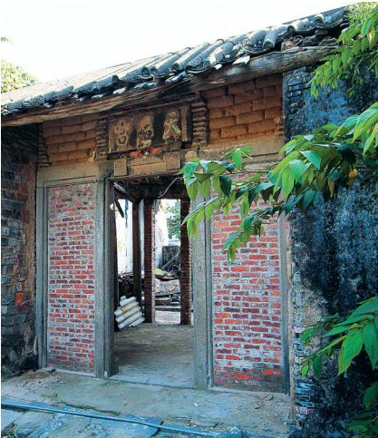
2006年底,记者在海口市海甸岛白沙门上村看到的破旧的天后宫。