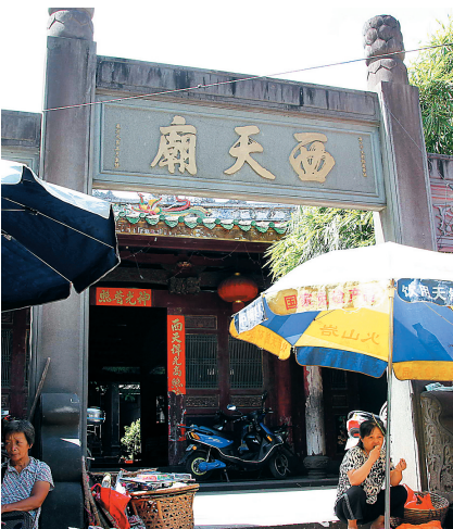
海口市龙华区义兴街75号的西天庙,匾额由清代探花张岳松题写。