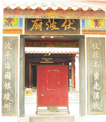
海口市海府路龙岐坡伏波庙。