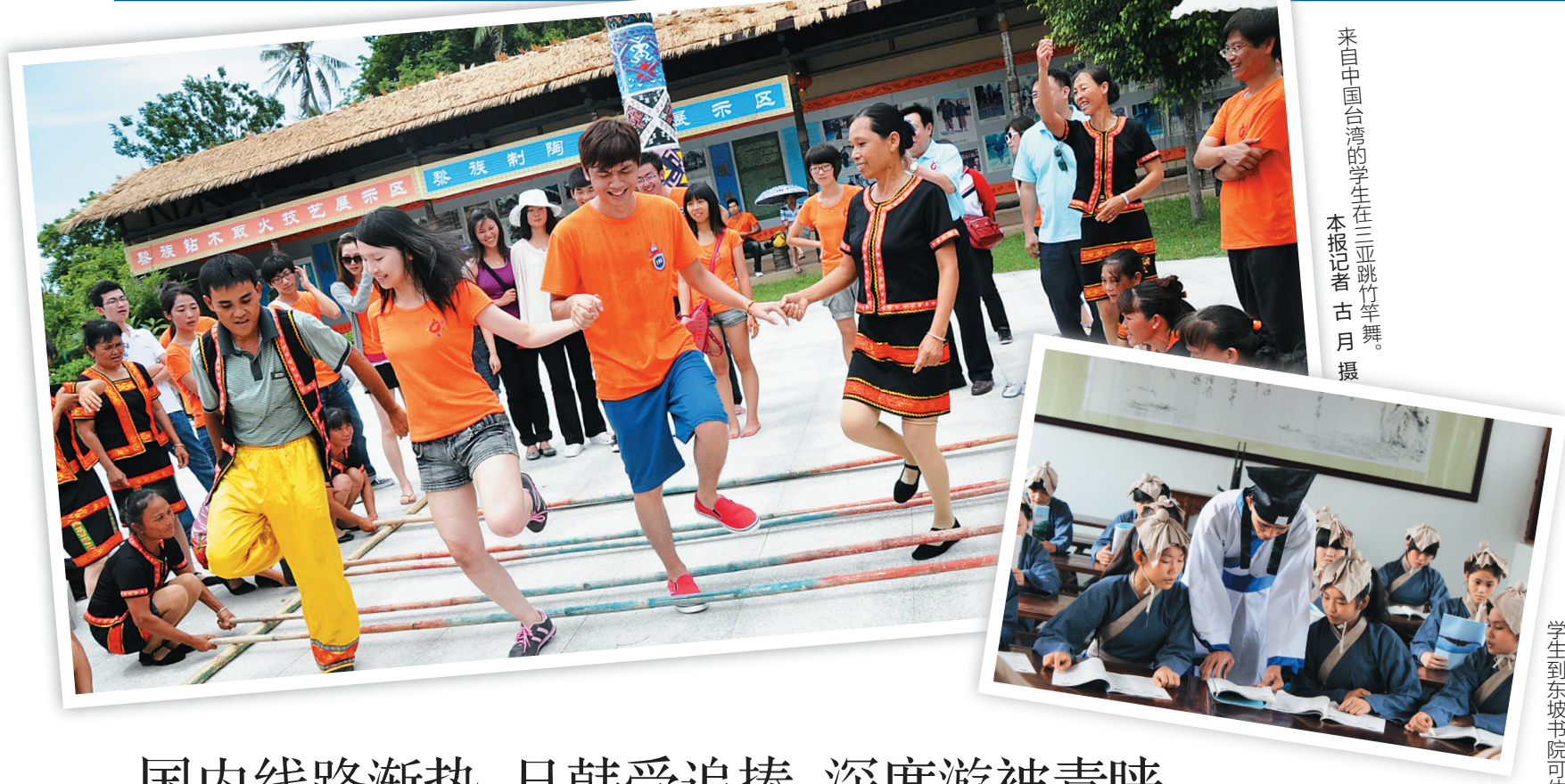
来自中国台湾的学生在三亚跳竹竿舞。