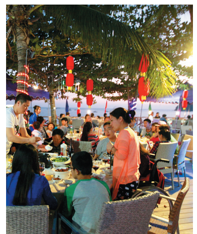
游客在三亚大东海海滩边品海鲜。

“行业的发展只有透明、公道才能走得长远。大众点评网聚集了很多消费者和商家,餐厅可以查看消费者点评听取意见,这是对餐厅服务和菜品非常好的监督方法,有助于海南餐饮业改进服务、推陈出新。”杨明新说。