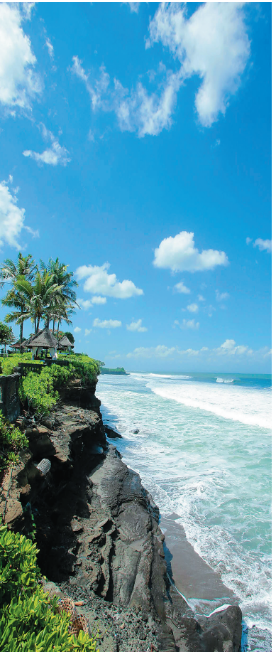
印度尼西亚巴厘岛美丽的海岸线。

得报警单。同时将登机牌、入境卡、行李托运牌等能证明申请人合法入境的证据保存好;然后携警方出具的报警单(原件和4份复印件)到中国驻当地使、领馆申办护照、旅行证等证件。中国使馆或总领馆在向国内发证机关核实申请人身份无误后,将颁发相应临时回国证件。在领取回国证件时,中国使馆或总领馆为申请人出具一份致印尼移民局的函。申请人携带以下材料到当地移民局办理出境手续:(1)警方出具的报警单原件及3份复印件;(2)新颁发证件原件及3份复印件;(3)大使馆或总领馆致移民局函的原件及3份复印件;(4)丢失、被盗护照复印件3份(如有);(5)入境卡、行李托运牌、登机牌等能证明申请人抵达时间的证据(如有);(6)回程机票;移民局在核查是否存在逾期滞留、违法犯罪情况以及工作记录。如无严重情况,移民官将为申请人办理离开印尼许可,在旅行证或回国证明上盖章签署并注明限期离境期限。