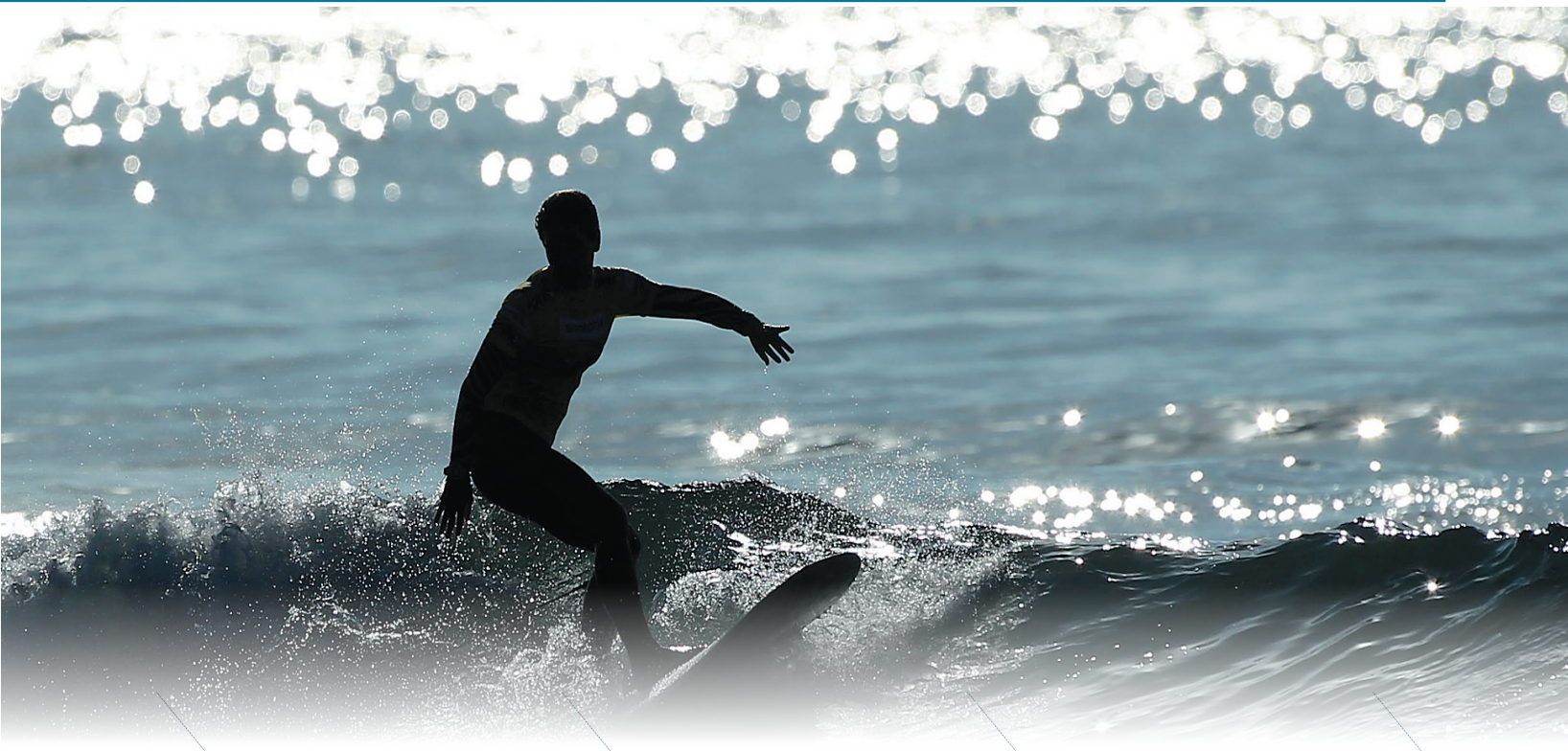
在日月湾，冲浪爱好者在浪尖起舞。