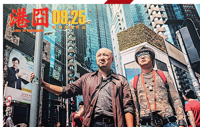
徐峥(左)包贝尔在《港囧》中

提出尖锐问题。其后，包贝尔更是步步紧逼，一路跟踪偷窥，一路搜集线索，一连串质问弄得徐峥一路狂奔，其执着无比、锲而不舍的“监视”如同“抓捕”，让两人在香港如同上演了一部港式大片的追逐戏码，枪战、爆炸、飞车、坠楼、街头火拼、动作戏码接踵而来，既可看到徐峥飞身救赵薇的镜头，也可让观众一个接一个地欣赏到很多噱头猛料，喜感极强。