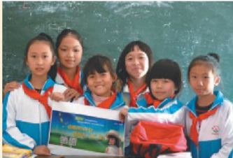
走进校园开展“电亮梦想微行动”

公司组织全系统职工捐款,向“威马逊”灾区捐资150万元,向云南雅安地震灾区捐款22万元,为受灾群众献上一份爱心。