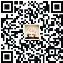
关注《文化周刊》 扫描二维码

近日,BBC电视台播出了名为《我们的孩子受得了中国学校吗?》的记录片。该片讲述在英国汉普郡的公立中学(Bohunt School),邀请了5名中国老师实施为期4周的中国式教学试验的故事。有趣的是,自从晚清洋务运动以来中国向来都是对外输出留学生,而如今我们的教育也挤入了“Made in China”的出口业大军,登陆英伦,似乎有望扭转“教育贸易逆差”的颓势。更具趣味的是,该片通过网络传播实现了“出口转内销”,众多在应试教育中死里逃生的中国人对此的反应更为激烈,他们用忆苦思甜的心态看完该片后,纷纷大呼有忝。 在片头,英国人危机意识十足地表示,在全球教育中英国学生正处于落后地位。中国老师则说,英国学生的受教育水平实际上已经落后于同龄中国学生至少三个学年。于是,英国人本着“发现问题”、“寻找差距”的逻辑顺序,自然而然地想要“奋起直追”。只不过,想要在为期4周的短时间内实现“赶中超中”的教育大跃进,势必是一场病急乱投医的闹剧。 紧接着,为了提高英国学生的考试成绩,我们耳熟能详的“魔鬼教育”粉墨登场了:先是像血汗工厂那样,从早上7点忙到晚上7点,从鸡叫学到鬼叫;再是统一穿上毫无美感的校服,做着整齐划一的早操;随后,在第一节课上,接受中国老师关于遵守纪律是学生第一素养的规划;并且,所有科目中最注重的无疑还是数理化,并且宣扬着它与学生的智商挂钩,猛烈地采取填鸭式教学,迫使学生速成。当然,如同在中国的绝大部分老师那样,这所公立中学的中国老师同样熟练地操弄着这些小伎俩:成绩差的同学单独坐,上课不认真的就在教室外罚站,早恋的同学还要接受“强制爱”的苦口婆心,当厌学情绪大面积爆发后则是用选举班干部的官能心理来激励学生。 如此种种,恍如隔梦,我们的童年记忆被反动着,倒也能激起一丝“幸灾乐祸”——没想到啊没想到,你们英国人也要叛变教育理念了?校长难道就不担心,中国式教育也会把英国学生批量生产成应试教育里的学霸与考霸,然而对他们的人生有多少用却无法确定。 在更大的层面上来看,对外输出商品需要质检,对外输出劳动力需要体检,那么对外输出教育模式是否也需要经过“智检”呢?显然,“智检”的标准绝不可能是考试成绩。倘若我们自诩的“德智体美劳全面发展”教育理念在本国尚存有争议,为什么要如此着急地把它投放于世界?