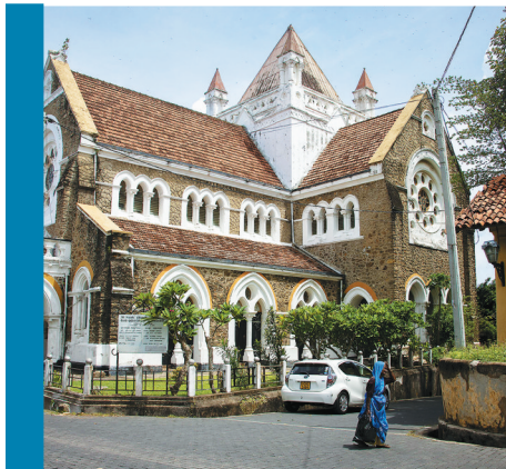
斯里兰卡加勒古城风景。