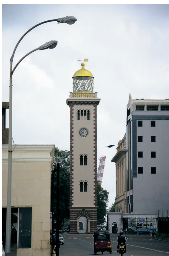
斯里兰卡科伦坡市区。

如果说邂逅斯里兰卡的微笑是此行难以忘却的回忆,那么在这个微笑国度里不时闪现的“中国元素”,令人惊喜之余,更让我们坚定这样一种信念:有着1600多年友好交往历史的中斯两国,在共同打造21世纪海上丝绸之路的恢宏历史进程中,两国友谊之花必将世代代绚丽绽放。