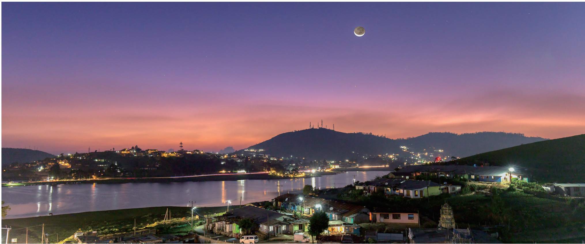
斯里兰卡古城夜景。(资料图)