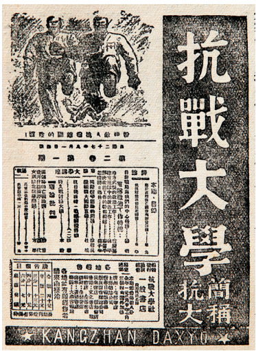
抗战期间，海南书局出售的《抗战大学》。

抗日战争是一场全民族的战争，是近代中国民族意识觉醒的体现，当时就提出了全民抗战的口号，这个口号的实施，就是一场行动，就是要进行宣传，使更多的人了解抗战，以动员更多的民众投身于这场伟大的民族解放的战争中，这是抗战时期中国文化界的一大任务。对于海南的抗战也是如此，岛内的文化人士，无论党派、政见，鉴于国家、民族的危亡，都在竭尽全力地从事着这项伟大的事业，也正是有这些努力，海南的抗战才有后来的迅猛势头。我们回顾这段历史，可以深切地感受到海南文化界在抗战中的热情、勇气与牺牲，依旧为抗战前辈们的艰苦奋斗而感动。