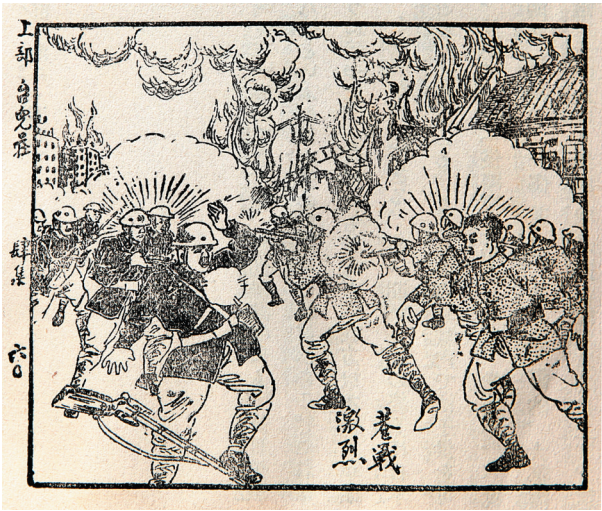
《绘本台儿庄》（静星制）出售。