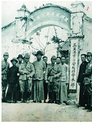
《画报跃进之日本》刊登日本军队侵占海南时在三亚成立治安维持会时的图片。

要摧毁一个民族的反抗力,就要摧毁这个民族的文化和意志。日本对海南岛的侵略,既注重以军事手段强占掠夺,也十分重视从思想、政治、经济、教育等方面对中国民众进行思想控制和文化渗透。为此,日军专门设立了文化统治机构,通过强化殖民教育、管控大众传媒,消减民众的抗日意识,传播“大东亚共荣”的理念,通过日语教育向岛民灌输日本文化,妄图将他们教化天皇治下的顺民和开发海南岛的重要劳动力,为永久占领海南岛奠定文化基础。