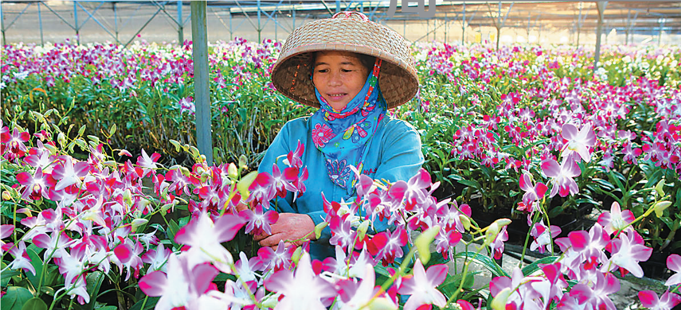
海口柏盈兰花基地里,石斛兰开出艳丽的花朵。

海南是“插根扁担都能发芽”的生态海岛,气候条件和生态环境宜人,而热带兰花本性喜暖畏寒,喜欢高气温、高湿度的环境,海南就如同一个天然的热带兰花“大温室”,这里生长着形色各异的热带兰花,绽放着姹紫千红的美丽。 “海口兰花产业园”项目是“海口市南渡江流域土地整治重大工程项目”区域内投资建设的首个重点项目,也是该区内的产业扶贫示范项目。目前,产业园累计投资5亿多元,基地一期工程已建成投产,配备有高标准智能温室及配套生产设施等,种植蝴蝶兰、文心兰等热带兰花有400多万株,年产值达7000万元。