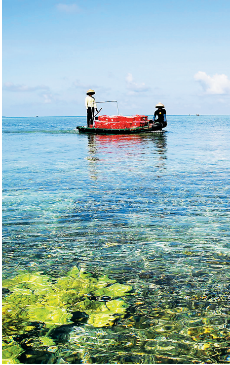
全富岛海滩。