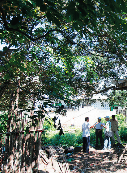
海口市琼山区美仁坡黄魂故居只剩下枝叶繁茂的大树。

原琼山县党史办主任王万江曾对黄魂的事迹做过深入的调查研究,“遇到危险面对敌人他向来都有勇有谋。”