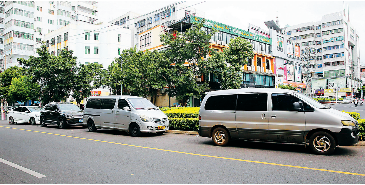
8月13日,在海口市建国路,车辆在没有划线车位内乱停放的现象依然存在。