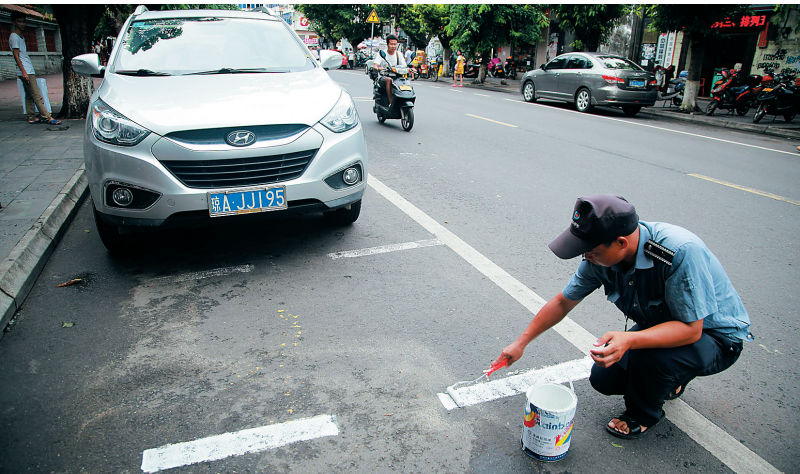
工作人员在划公共停车位。

海口警方介绍,目前警方每天有1000多名警力上路整治交通。根据海口警方整治违停有关要求,第一次违停的交通违法者,交警一律进行实名信息登记、照相,录入交通违法人员信息管理系统。