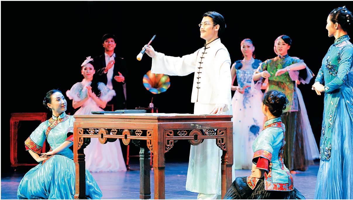
《泥人的事》精彩片断。