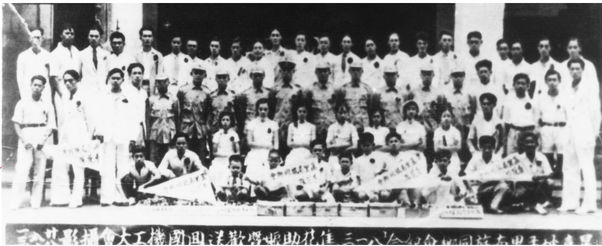
1939年8月13日,新加坡孟里同乡会纪念“八一三”售花助赈暨欢送回国机工大会合影。