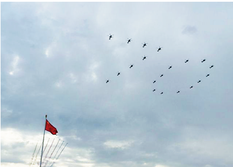
直升机编队在演练中摆出“70”字样。

仗队女仪仗队员将首次亮相阅兵。 据介绍,在中国人民抗日战争暨世界反法西斯战争胜利70周年阅兵中,51名三军仪仗队女仪仗队员将按陆、海、空军各一列,每列17人的队形,整齐排列在三军仪仗队方队第10至12排。 2014年2月,三军仪仗队在北京军区范围遴选了第一批女仪仗队员,这也是三军仪仗队建队62年来首次招收女仪仗队员。女仪仗队员自2014年5月12日首次亮相外交礼仪至今,已完成各类任务近百起,受到国内外各界广泛赞誉。 据了解,参加此次阅兵的三军仪仗队女仪仗队员平均身高1.78米,平均年龄20岁,大学及以上学历达88%。