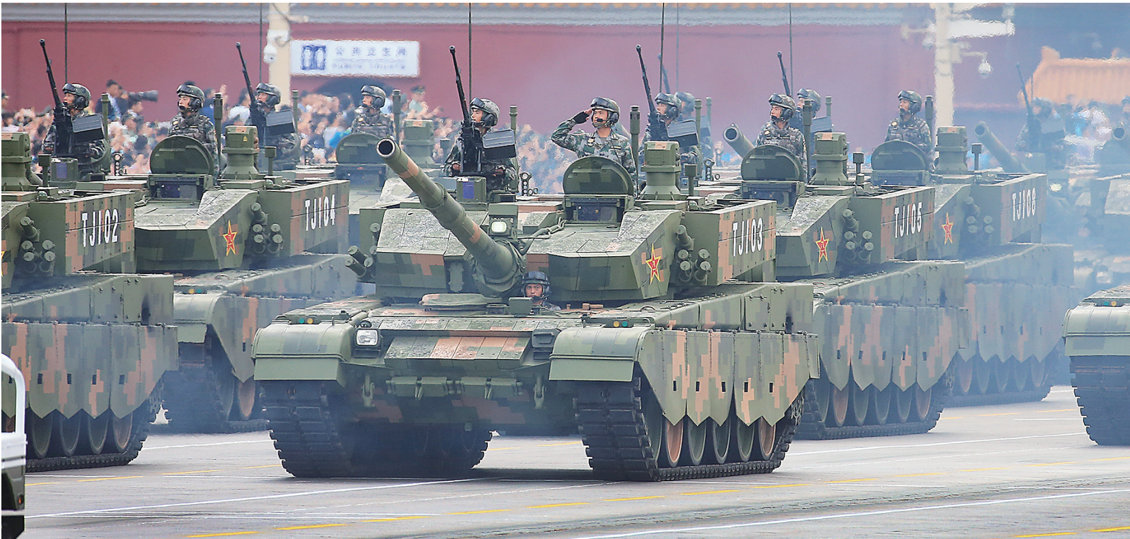
这是参加演练的装备方队。

新华社北京8月23日电(记者李宜良)为确保纪念中国人民抗日战争暨世界反法西斯战争胜利70周年大会的顺利进行,现场磨合纪念大会各项组织工作,自8月22日夜间至23日上午,在天安门地区及长安街沿线进行了纪念大会专项演练。 据了解,此次演练为全流程、全要素演练。抗战老兵、抗日英烈子女和抗战支前模范代表参加演练。俄罗斯、哈萨克斯坦、蒙古等应邀参加阅兵的10多个外国军队方队或代表队,参加了分列式演练。1万多名官兵、500多台装备、近200架飞机演练了阅兵式和分列式;国旗护卫队,解放军联合军乐团、合唱团,礼炮分队,以及负责纪念大会报道的中央有关新闻单位也参加了演练活动。参加演练的人员精神饱满,所有演练过程顺利有序,各项演练取得预期效果,为进一步做好纪念大会的各项组织工作积累了经验。3.5万余名各界观众现场观看了演练。 为最大限度减少对市民工作生活的影响,演练活动安排在周末进行,并提前发布公告,科学安排交通运输,保障城市正常运行。据了解,广大市民对专项演练表示充分理解,并给予积极支持。演练期间北京城市运行有序正常。