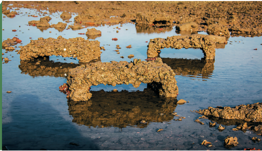
海口市演丰镇林市村旁的琼北大地震遗址。