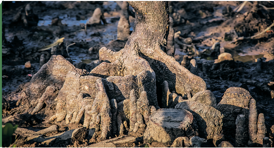
盘根错节的红树林根部。