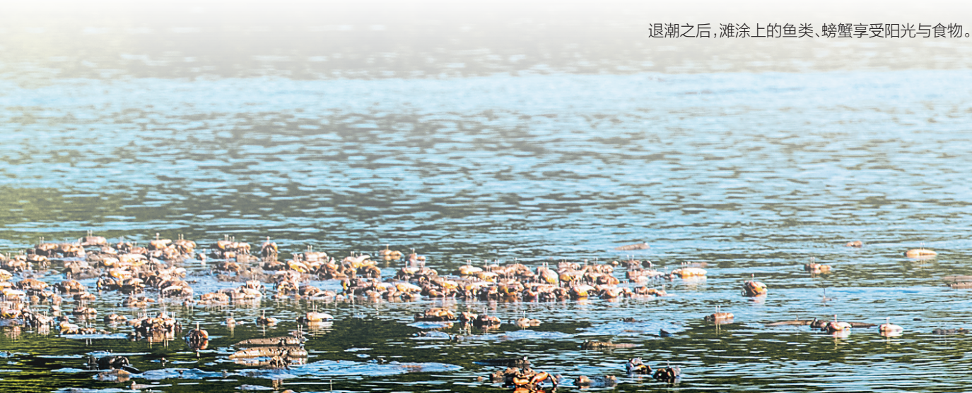
退潮之后，滩涂上的鱼类、螃蟹享受阳光与食物。