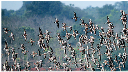
盘旋红树林上空的群鸟。