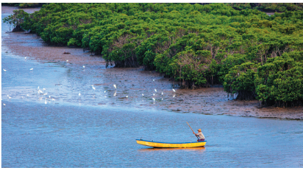
保护良好的红树林，是一道绿色风景。