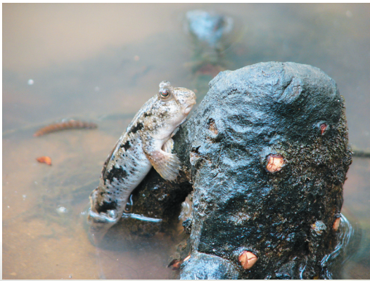
东寨港水中玩耍的弹涂鱼。