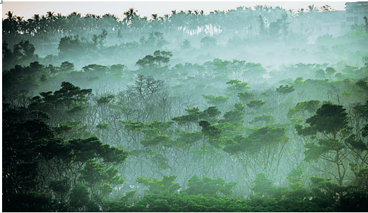
清晨，一缕阳光透射在红树林旅游区内的红树林。宛如人间仙境。