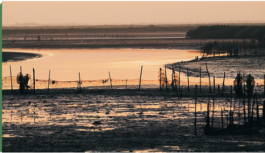
“沧海桑田”——东寨港成全了这个千古成语的确切表达。