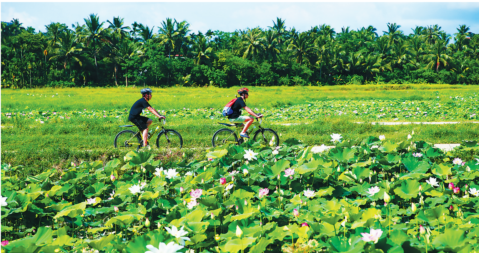
游客在琼海市龙寿洋万亩田野公园骑行。

规划单位在规划乡村旅游产品时,不可以仅仅是设计规划硬的产品,软的环境设计,同样要注意,比如墙上的标语、绘画、门上的雕刻,门上的对联等等。要使旅游者享受环境的同时,感受好的文化环境,从舌尖到脑袋有一个提升,需要润物细无声。 从舌尖到脑瓜,三寸之远,却是心的距离。乡村旅游关键是化解一种乡愁,这需要心贴心的经营,不仅要经营美味、经营生态、经营效益,还要经营乡情,经营心灵,经营家的感觉。 (第一旅游网)