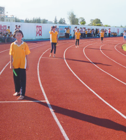
东澳镇初级中学活动丰富多彩。

近年来,万宁把破解人民群众关切的教育热点难点问题,作为为民办实事的突破口,将教育事业作为“第一民生工程”来抓。以深化课程改革、均衡发展为契机,以“强队伍、促均衡、树品牌、为民生”和“办好人民满意的教育”为目标,推进教育管理体制改