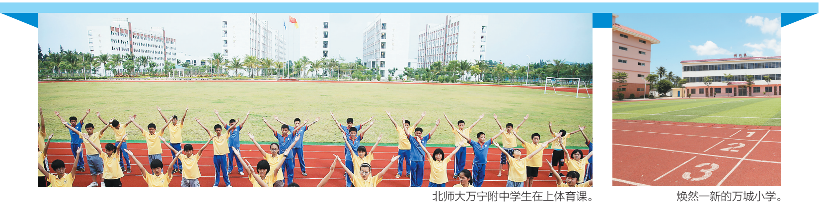
北师大万宁附中学生在上体育课。

在吴波志看来,学校间的良性竞争,受益的是广大万宁学子。他举例说,今年中考,全市700分以上人数从去年121人猛增至488人,按照以往,仅靠一个之力难以做到。“北师大万宁附中带活整个万宁教育,取得全市成绩的跨越式提升,皆大欢喜。”吴波志说。