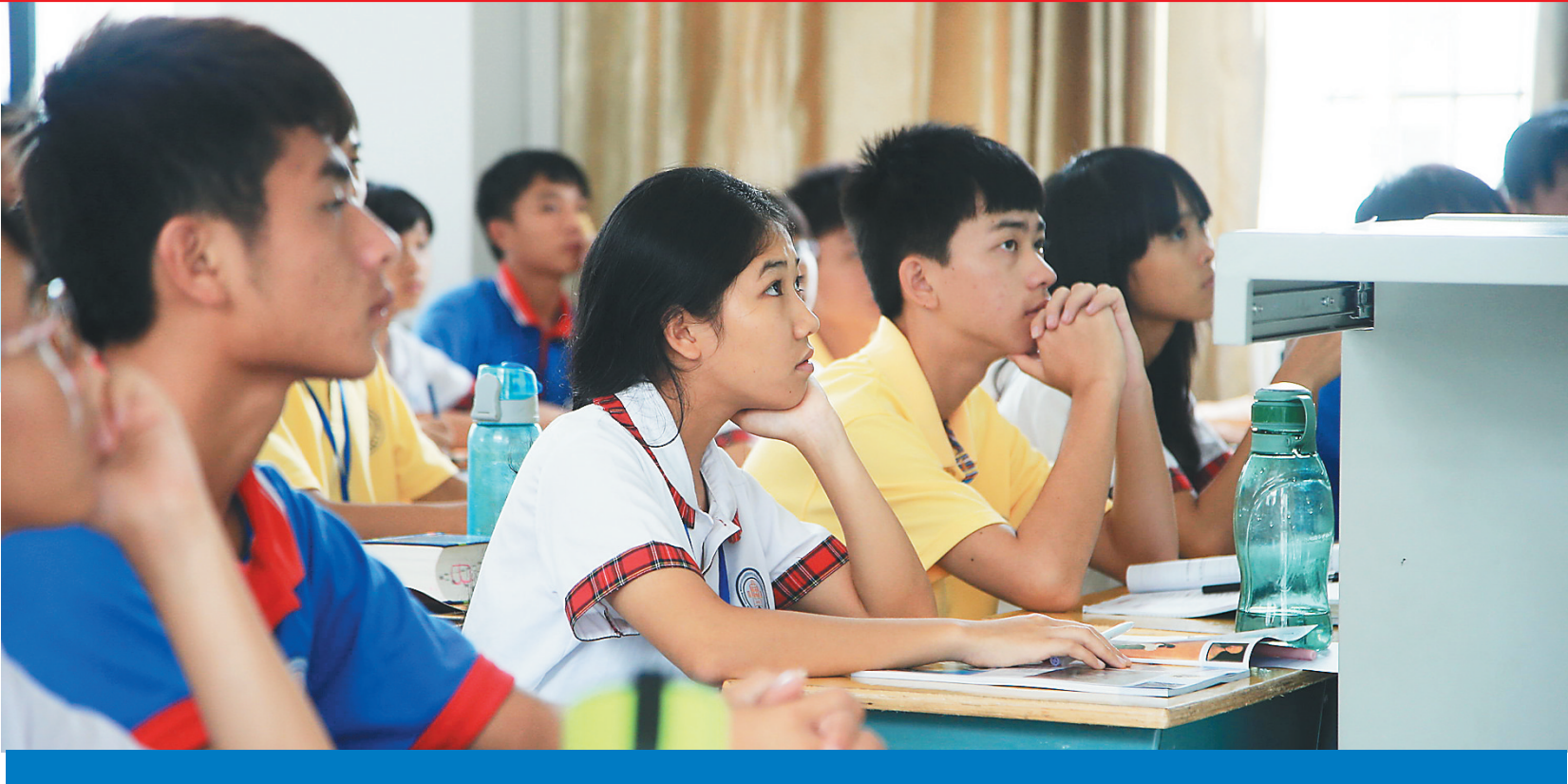
在北师大万宁附中,学生在课堂上课。