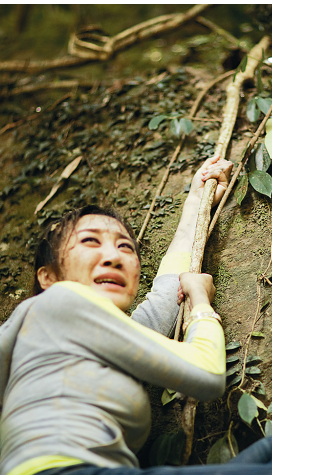
《新青春之歌》剧照

点点萤火映衬着寂静的山岭,青年的歌声伴随偶尔的蝉鸣鸟叫传向远方……这幅天人合一的美景,是电影《新青春之歌》为观众呈现的夜晚,也是海南鹦哥岭自然保护区最真实的夜晚。 8月28日下午,参考《光明日报》纪实报道《一种有远见的生活方式》,根据现代大学生模范典型形象——鹦哥岭青年团队先进事迹拍摄的电影《新青春之歌》在海口首映。前来观影的海口观众纷纷表示,这部电影生动刻画了鹦哥岭青年团队“坚守理想,奉献青春”的励志形象,讲述了一段青春、梦想、情感交织升华的感人故事。