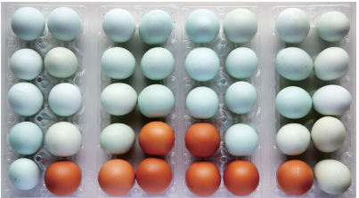
绿壳鸡蛋与当地红壳鸡蛋对比色彩分明。