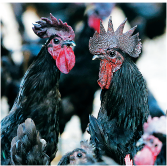
雄起珍禽良种产业专业合作社饲养的原种黑羽乌鸡。

雄起合作社是我省唯一的原种“五黑”绿壳蛋鸡养殖基地,现有社员106户,生鸡存栏量7万只,其中蛋鸡2万只,日产蛋量4000枚左右。这里出产的生鸡和绿壳鸡蛋,因品质极佳而备受消费者青睐,远销北京、上海、广州等地。目前,儋州市正着手扶持绿壳蛋鸡养殖产业,欲将绿壳鸡蛋打造成儋州农业又一知名品牌。