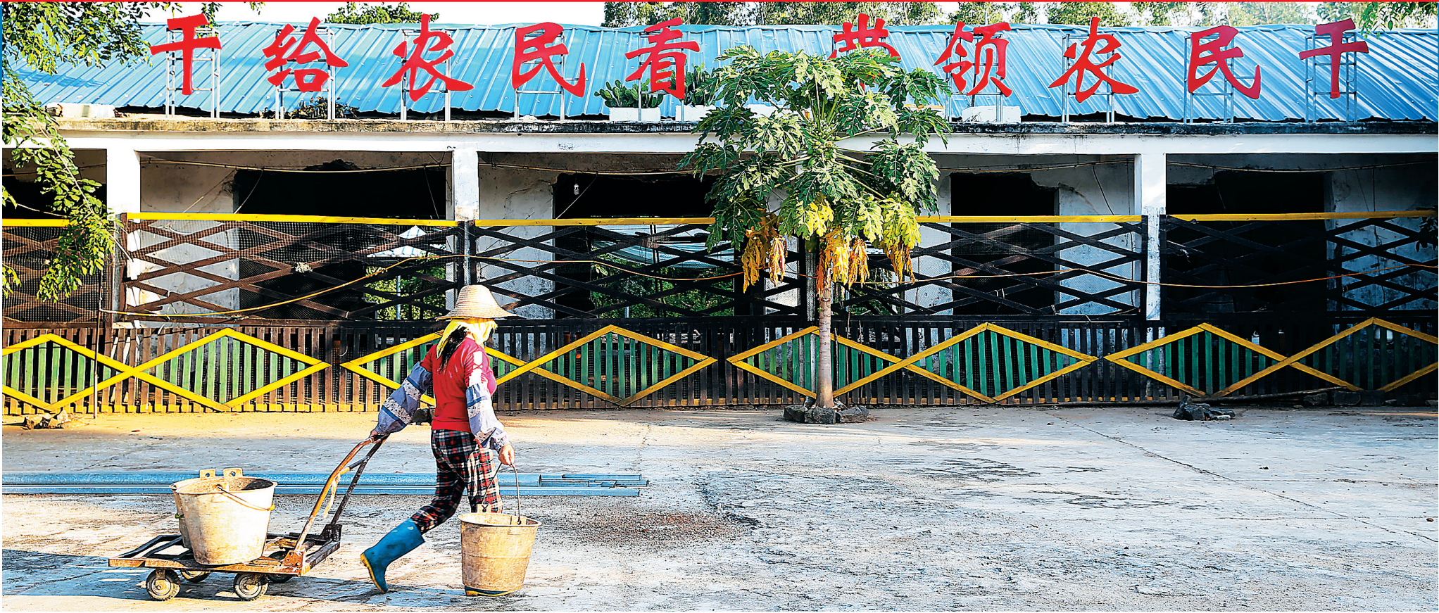
雄起合作社“干给农民看 带领农民干”的标语格外醒目。