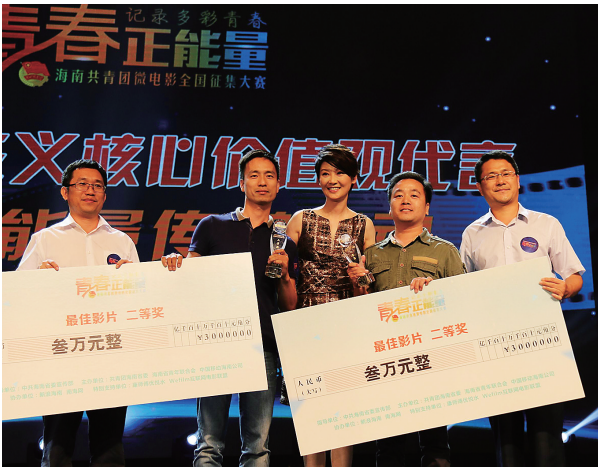
团省委副书记曾锋(左一)和著名演员徐帆(左三)为获奖作品颁奖。