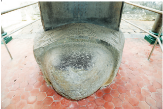
螭趺碑座。