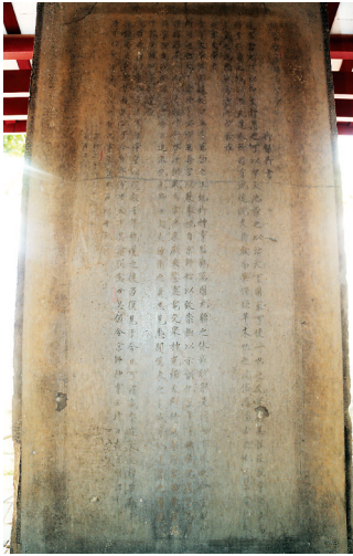
瘦金体刻字。

负责监制这块碑的几个人，蔡脩、谭稹、梁师成，都是宋徽宗时宰相蔡京的亲信党羽。蔡脩是蔡京的儿子；谭稹是依附蔡京，出任河北、河东、燕山府路宣抚使，是主持北方前线防务的主帅；梁师成是宦官，官至检校太傅，凡御书号令皆出其手，并找人仿照帝字笔迹伪造圣旨，因之权势日盛，甚至连蔡京父子也谄附，时人称之为“隐相”，宋钦宗即位后贬为彰化军节度副使，在行至途中时被缢杀。