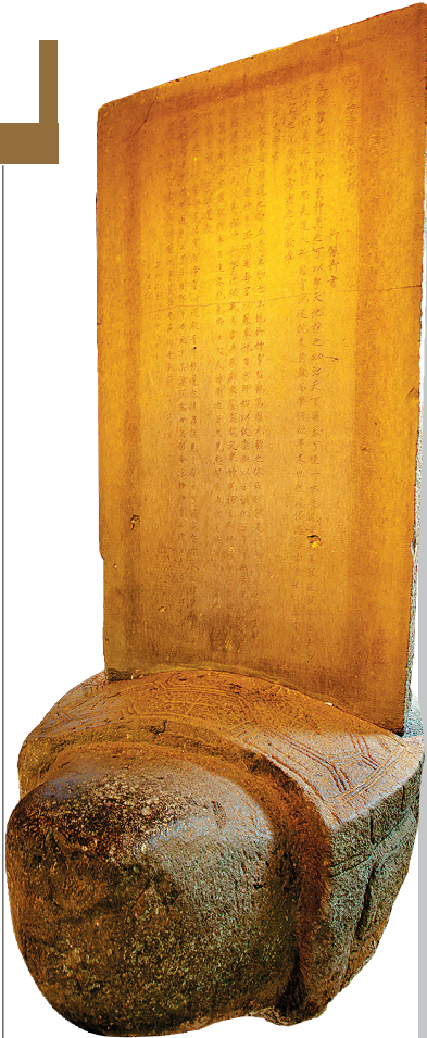
海口市五公祠内的神霄玉清万寿宫诏碑。

碑刻，乃中国古代艺术瑰宝。在我省全国第一次国有可移动文物普查过程中，浮现出了一批珍贵的古代碑刻，其中当数海口市五公祠内收藏的神霄玉清万寿宫诏碑至为珍贵。 神霄玉清万寿宫诏碑，是迄今发现的见于金石著的宋徽宗“瘦金体”字数最多、最成熟的碑刻。 神霄玉清万寿宫诏碑目前全国仅存两尊，原存海南琼州府城的天庆观万寿宫，1983年移立于海口市五公祠，为第五批全国重点文物保护单位。