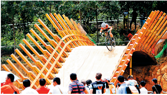
参赛选手在通过立交木桥。