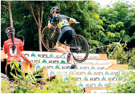
参赛选手通过台阶障碍。