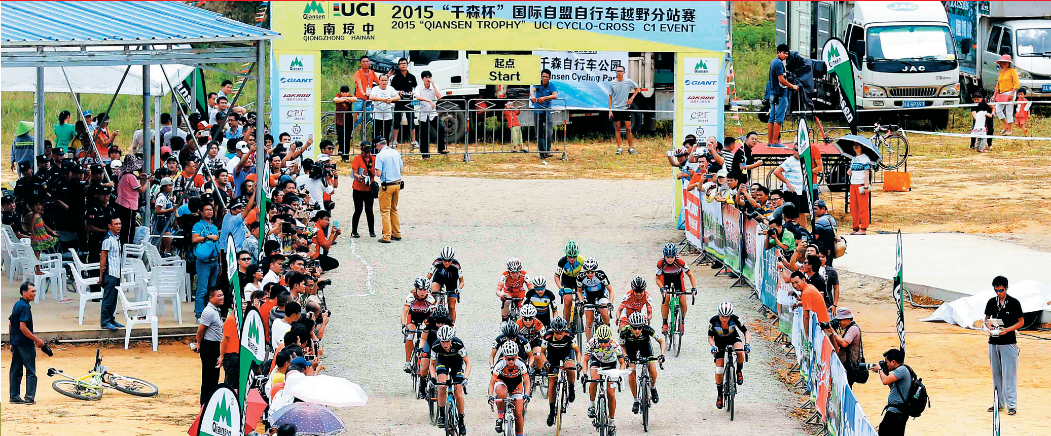
「千森杯」国际自盟自行车越野一级赛琼中分站大赛鸣枪开赛。