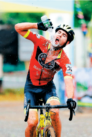
参赛选手在喝水降温。

琼中分站赛事由国际自行车运动联盟(UCI)批准,海南省文体厅、琼中黎族苗族自治县人民政府共同主办,琼中文体局承办,赛道设计建造方千森集团全程协办运营,赛事主题为“骑行山水,畅游琼中”。