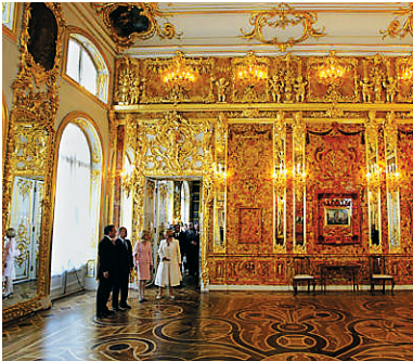
德国总理、俄罗斯总统于2013年曾一同欣赏重建后的琥珀宫。

发现了破绽，他们将“琥珀宫”拆卸下来，装满27个箱子运回了德国的哥尼斯堡（即今天的俄罗斯“飞地”加里宁格勒），这儿是世人所知“琥珀宫”最后停留的地方。“二战”末期，哥尼斯堡几乎被炮火夷为平地，“琥珀宫”从此下落不明，彻底销声匿迹。 琥珀宫无故离奇失踪后，各种传言随之甚嚣尘上，有历史学家认为琥珀宫毁于战争，也有人则坚信，德国人将琥珀宫安置于某处，确保其安全性。 据悉，由于苏联红军在二战末期包围了现名瓦罗克劳（Wroclaw）、旧名布雷斯劳（Breslau）的城市，纳粹在情况危急下，连夜将所有贵重财物装到火车上，打算运到德国境内，不料却消失在波兰与捷克边境的山区。另外，根据瓦罗克劳电台引述当地民众传言表示，当时火车进入克雄日城（Ksiaz）附近一处隧道后，便再也没有看过火车的踪影。而随着隧道被关闭后，其真正的所在位置早已被人遗忘。 （综合）