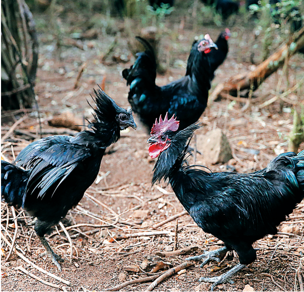
两只儋州雄起珍禽良种产业专业合作社饲养的原种黑羽乌骨鸡在打架,野性十足。