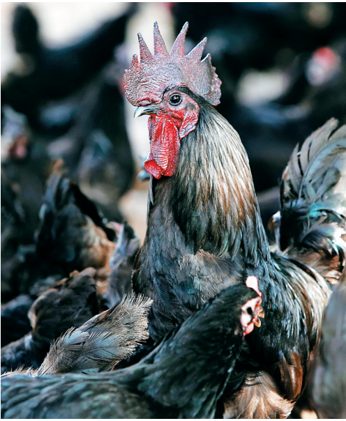
儋州雄起珍禽良种产业专业合作社饲养的原种黑羽乌骨鸡，警惕的注视着陌生人的到来。