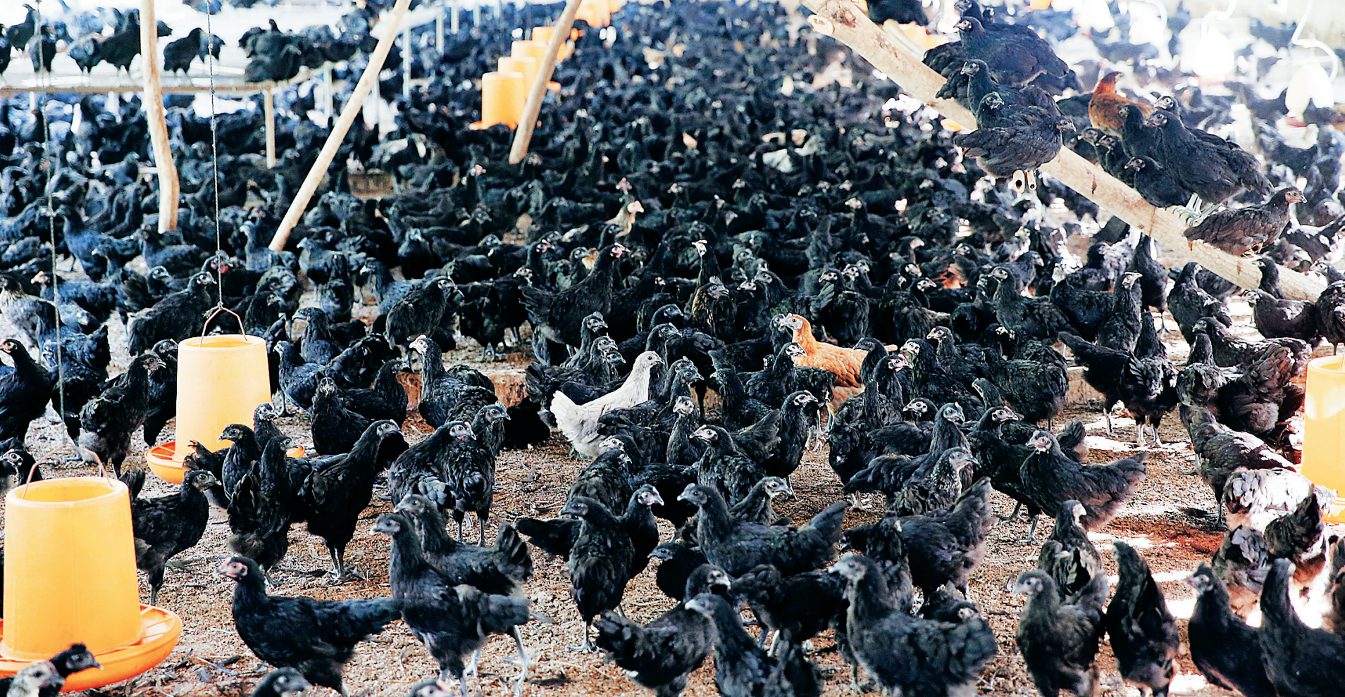
儋州雄起珍禽良种产业专业合作社饲养的原种黑羽乌骨鸡。