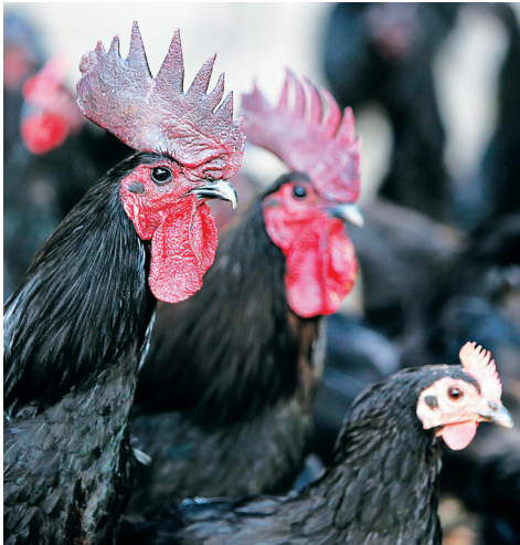
儋州雄起珍禽良种产业专业合作社饲养的原种黑羽乌骨鸡，有三分之一鸟的血统。

近日,海口美兰国际机场国内出发大厅售卖海南特产的货架上,悄然出现了一种新商品——儋州绿壳鸡蛋。这种包装精致、色如翡翠的鸡蛋,将搭乘飞机“飞”出海南,最终端上千家万户的餐桌。经儋州市政府及企业的努力,儋州绿壳鸡蛋的品牌逐渐打响,成为消费者青睐和信任的优质产品。