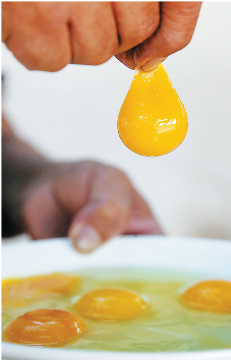
磕开5枚儋州雄起珍禽良种产业专业合作社的原种黑羽乌骨鸡蛋晶莹剔透，用手就能轻易提起蛋黄。