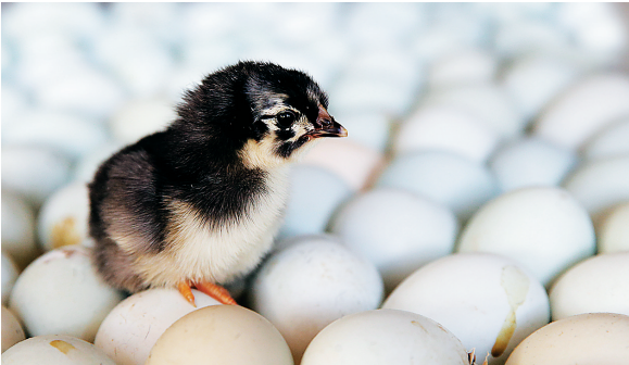
一只刚孵化出的原种黑羽乌骨鸡雏鸡。