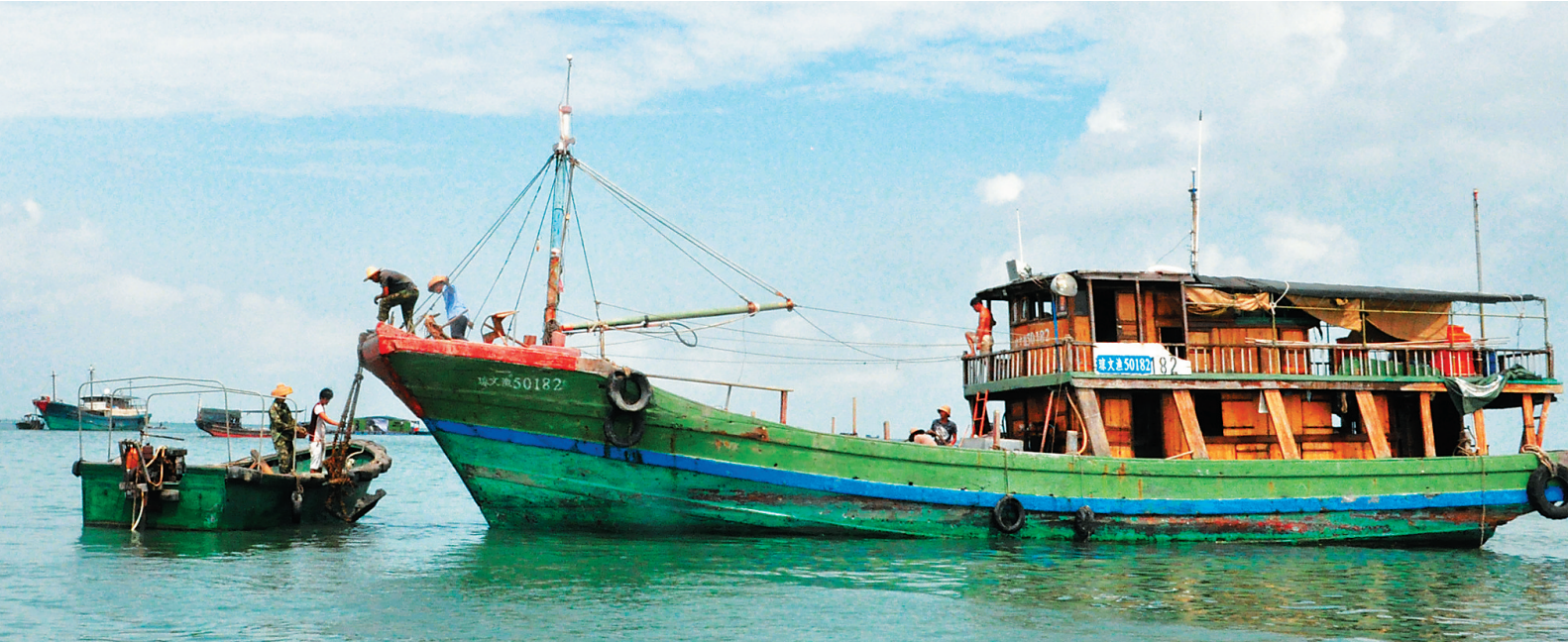
9月10日，在文昌市铺前镇，工作组成员正在帮助渔民进行海上搬迁，为铺前大桥建设“让道”。