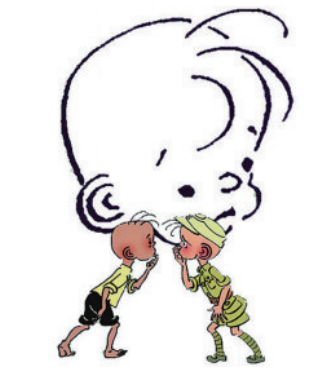
三毛的形象已成为经典。

提时代的张乐平因为常常帮着母亲剪纸样、描图案而渐渐喜欢上了美术。因家贫买不起作画用的纸笔，小乐平就以杭州湾的海滩为纸，以野地里的芦苇作笔，自由自在地在松软沙滩上画画，并常常因此乐而忘返。