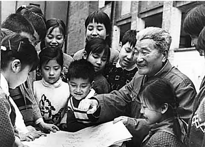
1977 年，张乐平和孩子们在一起。(资料照片)