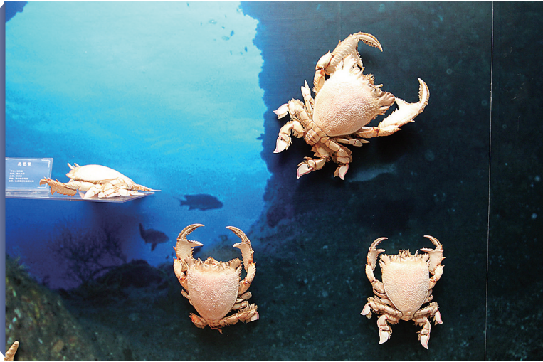
琵琶蟹标本。