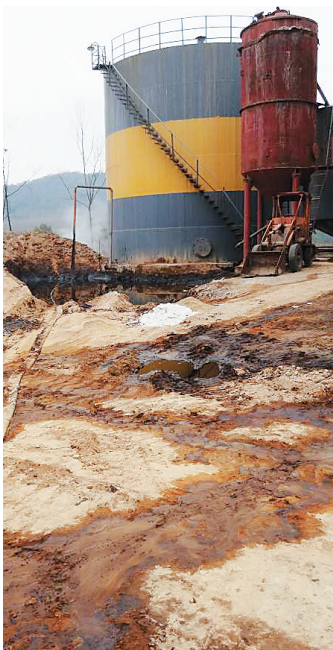
酒精废液浓缩罐泄漏成污染源。

由环保部发布的《环境保护公众参与办法》今年9月1日正式实施，这个“办法”将进一步激发群众对环境监督的参与热情。