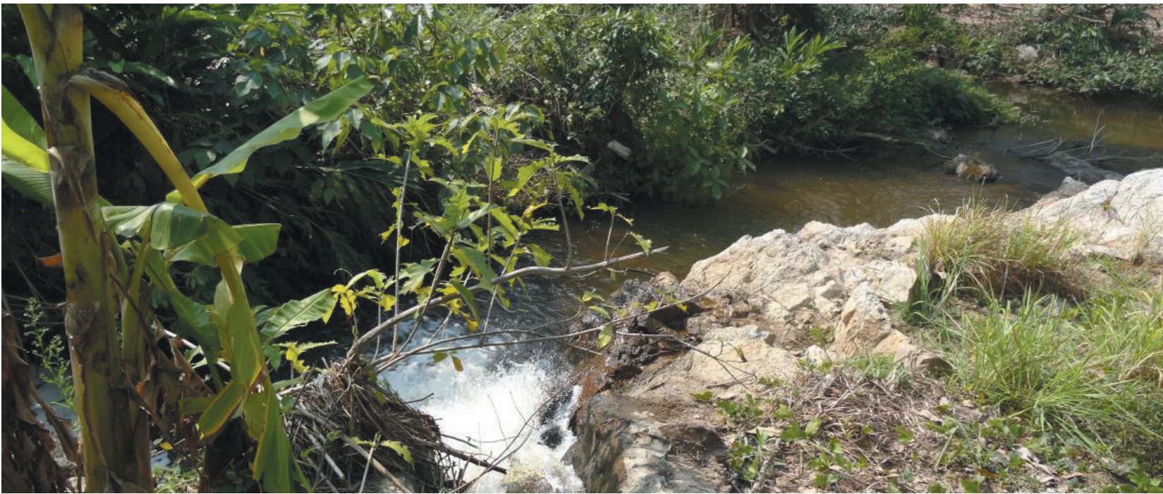
酒精废液流入白沙黎族自治县邦溪镇大米四队旁的河沟，污染了河水，当地村民为此开始了长达7年的举报。