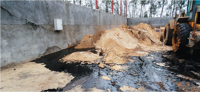
南大洋酒精厂一角。

13日，他发现河沟又变成了“酱油沟”，猜是酒精厂又向外排放污水，于是他立即拨打了12369举报。