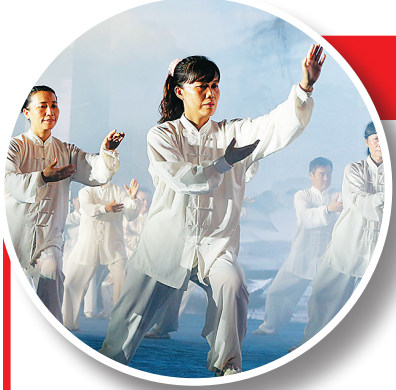
18日晚,省全民健身运动开幕式上简式太极拳表演。

另一方面,中国女足在经历了多年的动荡后,在今年世界杯上显露出些许复苏的迹象,女超联赛也在停摆多年后重新启动,再加上足球深化改革的“红利”,如果能够潜心苦练内功,扎实发展联赛和青训,中国女足重回世界一流并非没有可能,而这个过程最忌急功近利,特别是短期的唯成绩论,可能将多年打造的基础毁于一旦。