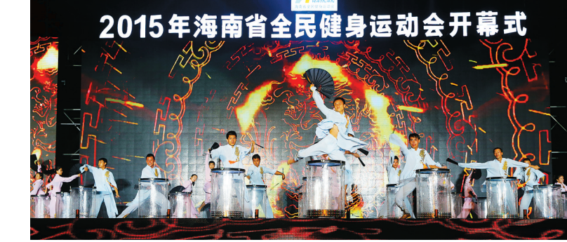
18日晚,省全民健身运动会在海口市万绿园开幕。本报记者 苏晓杰 摄

徐涛透露,在全民健身方面,海口还注意针对不同的群体,精心策划,组织开展各种群众喜闻乐见的体育活动。针对农村体育爱好者,海口市文体局组织开展乡镇农民篮球赛、农民趣味运动会、农民九人排球赛、体育乡村行、体育下乡等活动。组织社区体育爱好者开展全民健身体育大游园、社区篮球赛、乒乓球赛、体育进社区等活动。在中老年体育方面,组织开展健身气功展示、老年人运动会、门球赛等活动。这些活动每年定期开展,受