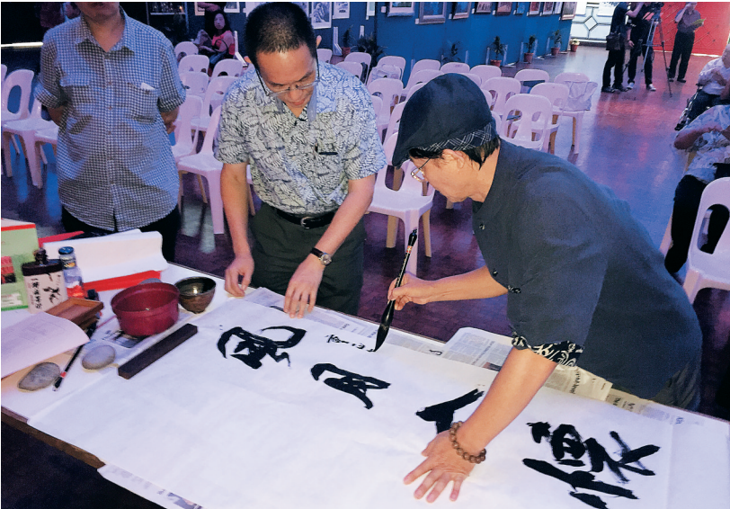
会展现场艺术家在创作。