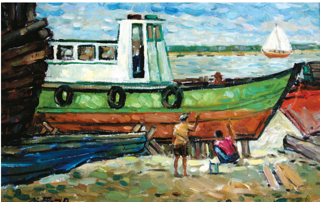
马来西亚画家伍尚平油画作品《修船》