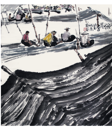
马来西亚画家曾昭承国画作品《补网》