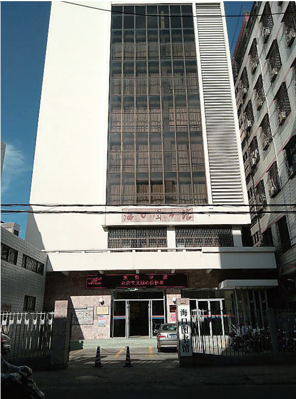
位于海口市新华南路的海口市图书馆，1986年落成，已难以满足市民日益增长的文化需求。

为了解海口青少年阅读状况，今年暑假期间，海南师范大学2015年大学生志愿者暑期文化科技卫生“三下乡”社会实践活动的一支调研团队深入到海口的图书馆、书店、学校和电影院等公共场所，从海口市民读书现状探究青少年阅读习惯，以调查问卷法和采访的方式调查了426名青少年，从海口市民读书现状探究青少年阅读习惯获得了一组与青少年阅读现状相关的数据。调查显示，省会海口只有3个公共图书馆，公共图书馆事业发展缓慢，影响了椰城书香的播撒。除此之外，只有7.04%的青少年认为自己的父母饱读诗书。家长如果自己缺少阅读习惯，要求孩子养成爱读书的习惯则不容易。