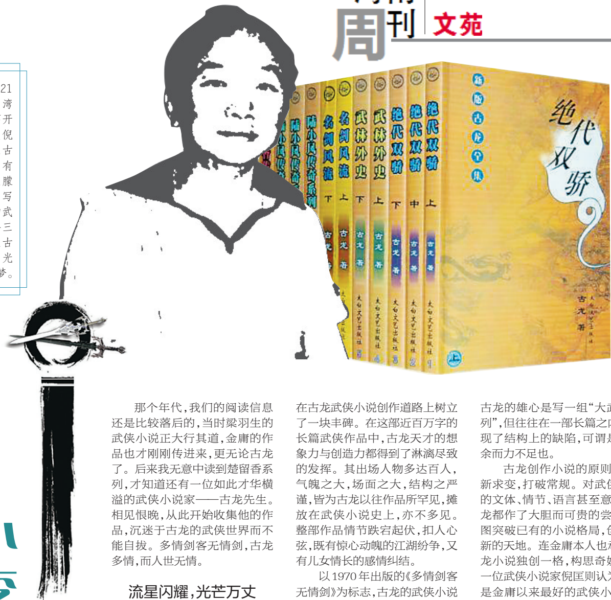
古龙与他的武侠系列作品

那个年代,我们的阅读信息还是比较落后的,当时梁羽生的武侠小说正大行其道,金庸的作品也才刚刚传进来,更无论古龙了。后来我无意中读到楚留香系列,才知道还有一位如此才华横溢的武侠小说家——古龙先生。相见恨晚,从此开始收集他的作品,沉迷于古龙的武侠世界而不能自拔。多情剑客无情剑,古龙多情,而人世无情。