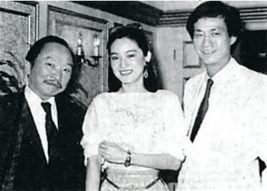
古龙(左)与影星林青霞郑少秋

古龙死于酒,死于无节制的酒色生活。当然,更大的可能是死于海明威那种无法写作的孤独。有人说:“酒是纵横江湖的侠客,茶是隐逸山林的高人。”这样说来,作为武侠小说家的古龙无酒不欢也是理所当然的了。酒是古龙创作武侠小说的催化剂,所以他笔下的人物大多好酒,大多一付醉态。也许,只有在醉眼朦胧之中,古龙才能写出那些满纸芬芳的武侠故事。让我们重温江湖里的刀光剑影,做一回白日梦。■