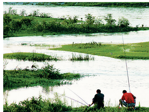
海尾湿地休闲垂钓。