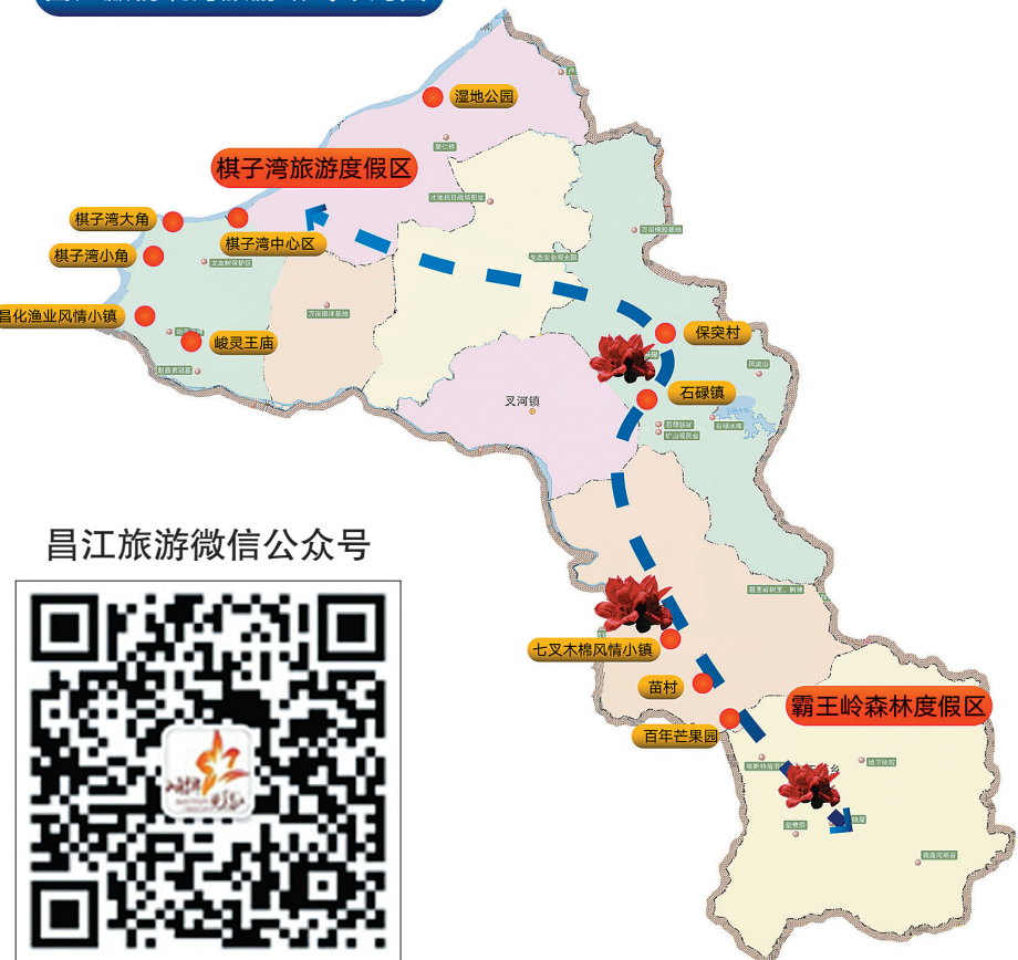
昌江旅游微信公众号