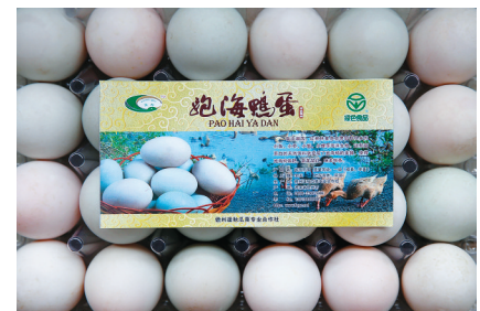
目前，儋州市逢秋瓜菜专业合作社的跑海鸭蛋行销岛内外。