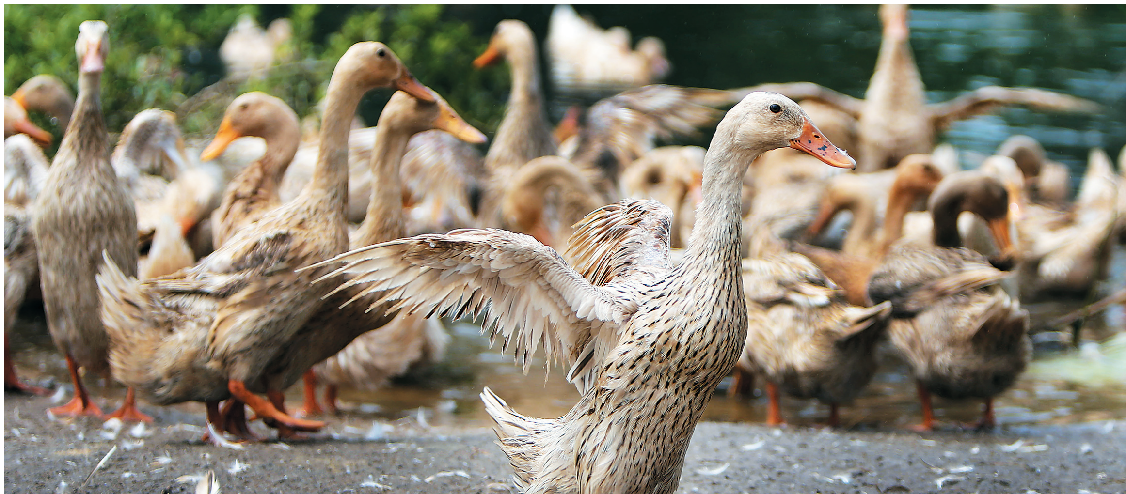
跑海鸭在沐浴觅食后走上岸边，欢快地舞动着翅膀。