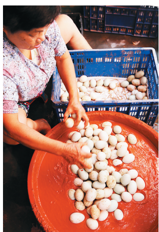
儋州市王五镇的阿婆正在用参盐的红泥腌制跑海鸭蛋。

在当地政府的支持和引导下，跑海鸭如今已成为儋州一个蓬勃发展的产业，正迅速成长为儋州新的农业知名品牌。