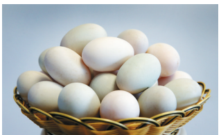
儋州市逢秋瓜菜专业合作社出产的跑海鸭蛋。