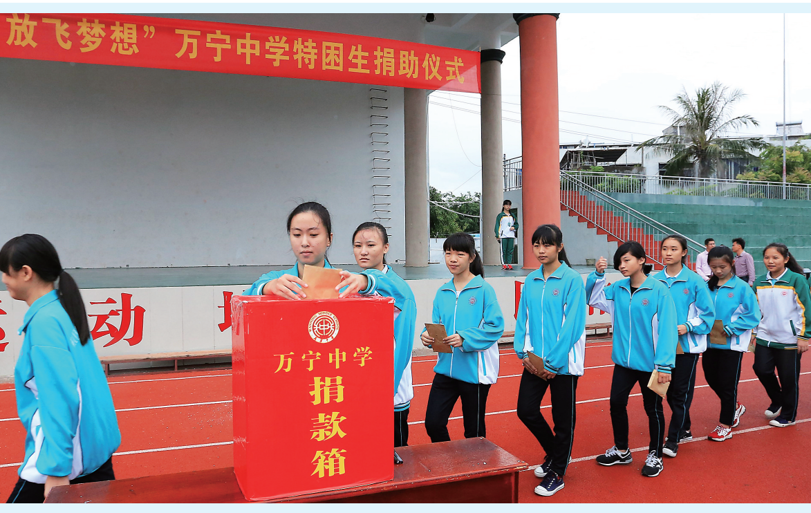
10月12日,万宁中学的师生们为特困生开展捐款活动。

目前,在失信被执行人黑名单的震慑下,秀英区法院成功执结多宗“骨头案”。失信被执行人黑名单进一步压缩了“老赖”的生存空间,捍卫了社会诚信和公平正义。