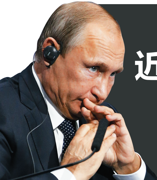
俄罗斯总统普京13日表示，俄方担心美军向叙利亚武装人员空投武器弹药会最终落入恐怖分子手中。