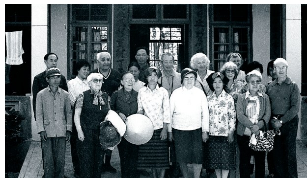
1980年代，马海德和外国专家在三亚。