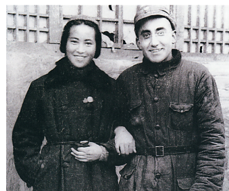
在延安，马海德获得了爱情。1940年3月3日和苏菲结婚，成立了幸福的小家庭。

在延安，一个是美国医学博士，一个是投身革命的上海滩当红电影明星，他们爱情的大胆程度不输给现在的年轻人，从不掩饰自己对对方的爱意，毫不避讳的拥抱告别，充满现代进步青年的勇敢，在延安那个激情燃烧的