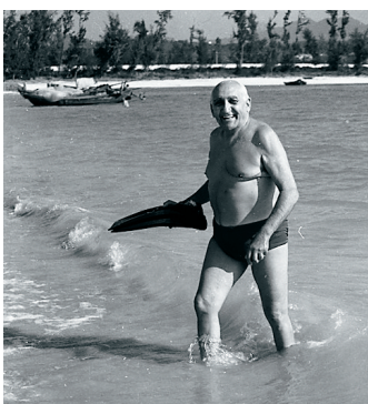
1982年马海德在海南三亚

“鲁迅先生说，‘俯首甘为孺子牛’，马就是具有这种精神的人，他真的像头牛似的把自己的全部力量都献给了中国人民的革命和建设事业。”1988年10月3日，丈夫马海德走了，留下苏菲，一生想念着丈夫，延续着丈夫对麻风病人的贡献，完成了丈夫未完成的筹建一个专门奖励麻风病医护人员的基金会。■