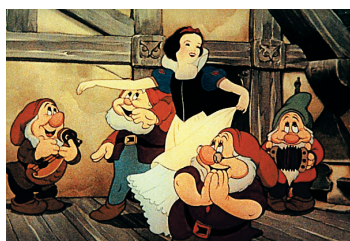
《白雪公主和七个小矮人》