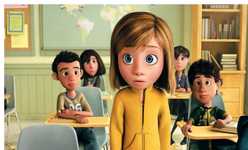
《头脑特工队》有典型的皮克斯画风

这里体现了皮克斯能够傲立全球数十年的最大杀手锏。皮克斯做动画从来遵循先繁后简的原则。比如我们现在看到片中每个角色脑中的小人一共有五个：乐乐（Joy）、忧忧（Sadness）、怕怕（Fear）、怒怒（Anger）和厌厌（Disgust），分别对应人类五种基本情绪——快乐、悲伤、害怕、愤怒和厌恶。不过他们研究的情绪却不止于此，最初设定出的情绪竟然达到了27种！在不断的比对、权衡后，道格特才将其凝练成了现在的这五个。经过这一番入简，五个情绪的概括性、区分度才会变成现在这么鲜明。