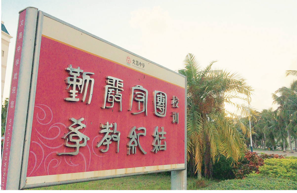
文中校训。

今年暑期,一则消息曾令文昌人振奋:2015年高考,文昌市800分(含会考、奖励分)以上考生达39人,刷新该市历史纪录,大幅领先绝大多数兄弟市县。对各界而言,这是文昌教育保持强势的信号。 欢腾之际,有人保持冷静。就在高考成绩出来不久,文昌教育系统内部就列举了本市教育需要面对的外在挑战和内部薄弱环节。这些问题直到如今仍然需要面对,并尽快加以解决。对文昌教育而言,大的困境或许并不明显,但居安思危的意识正在持续生长。