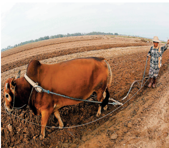
儋州，一名老农民在用耕牛犁地。