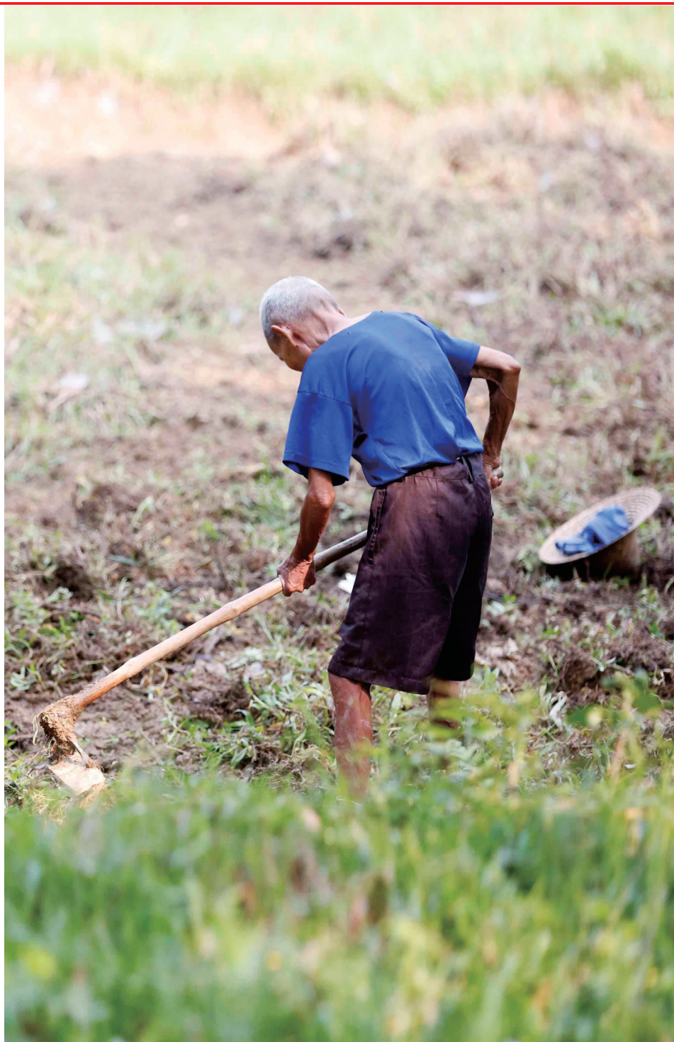
十月十六日，在屯昌，一位八十六岁的老人在田里耕作。