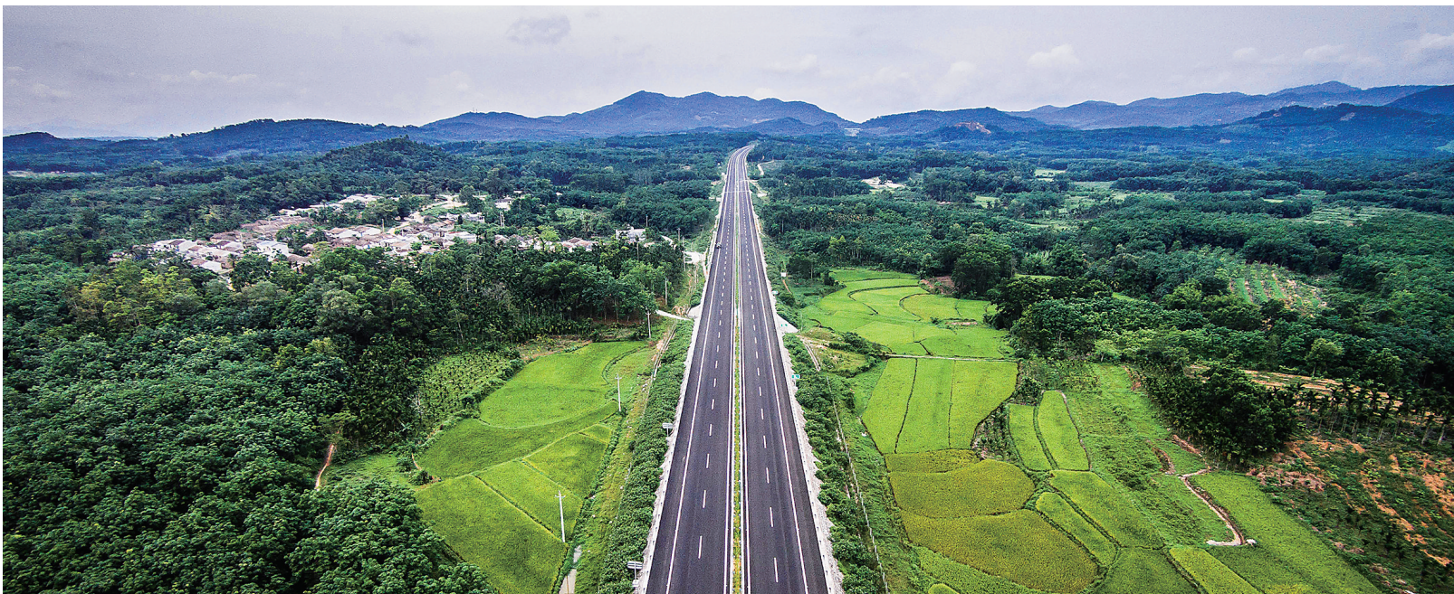
屯琼高速公路今年通车后，不仅方便沿线百姓出行，还大大拉动了当地经济发展。

“十二五”以来的五年，是我省推进科学发展、绿色崛起，为全面建设国际旅游岛、全面建成小康社会打下坚实基础的重要时期。十八届五中全会即将召开，时值“十二五”收官之际，本报今起开设“数说精彩十二五”专栏，从基础设施、优美生态、农民增收和民生发展四个方面集中展现我省在“十二五”期间取得的辉煌成就，营造全省上下齐心协力建设国际旅游岛的良好舆论氛围，敬请关注。