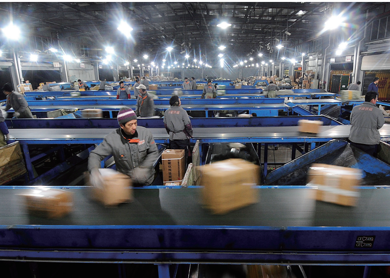
快递公司的员工在流水线作业。

安全,但他们对实名制能否马上严格执行存有疑虑,希望国家层面出台相关细则,指导企业进一步落实。