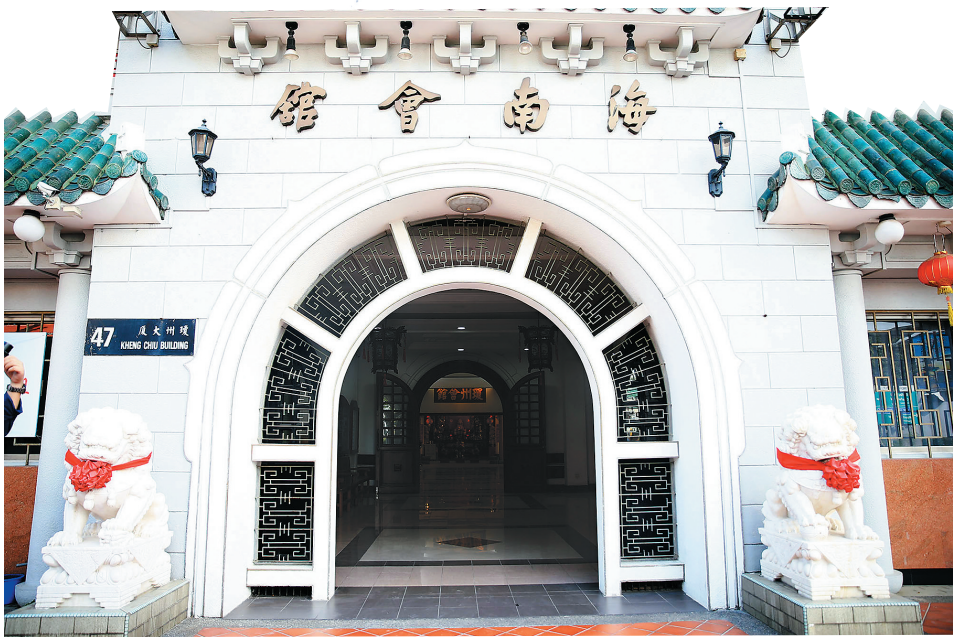
新加坡海南街上的海南会馆。

新加坡海南会馆(原名琼州会馆)成立于1854年,迄今已超越了一个半世纪,今年迈入161周岁。1857年正式拥有自己的会所,与琼州天后宫共用,地址最初设在小坡马拉峇街六号相连的屋宇,作为南来同乡联络乡情及供奉天后圣母、水尾圣娘及昭烈一百零八兄弟诸神明的场所。