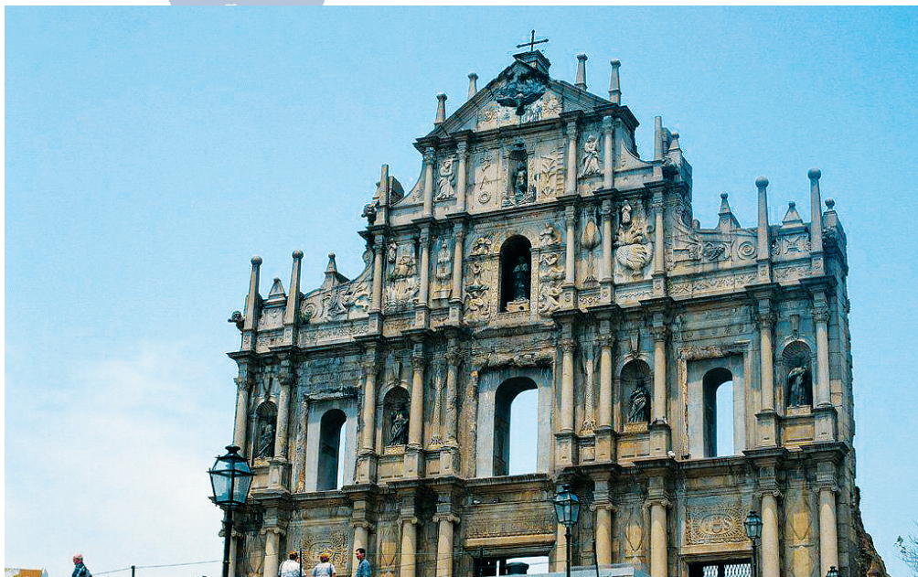
澳门大三巴牌坊。(资料图片)

澳门海南同乡总会由会员大会、理事会及监事会组成,分设会长、常务副会长、副会长、理事长、副理事长、监事长、副监事长、理事和监事等职称;还设秘书处、总务部、财务部、福利部、妇女部、青年部等部门,负责各项会务工作。